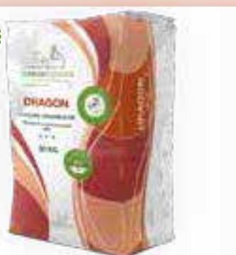
DRAGON Concime Organico NPK

DRAGON e' un fertilizzante totalmente organico per la concimazione delle colture orticole, industriali e del frutteto.