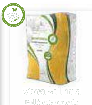
VeraPollina Pollina Naturale