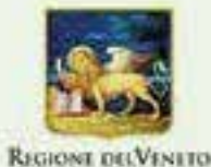
REGIONE DEL VENETO