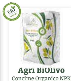
Agri BiOlive Concime Organico NPK