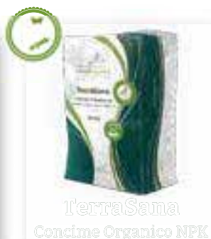
TerraSana Concime Organico NPK