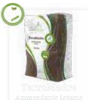
TerraMadre Ammendante Letame

Chiedi i nostri prodotti nelle migliori rivendite